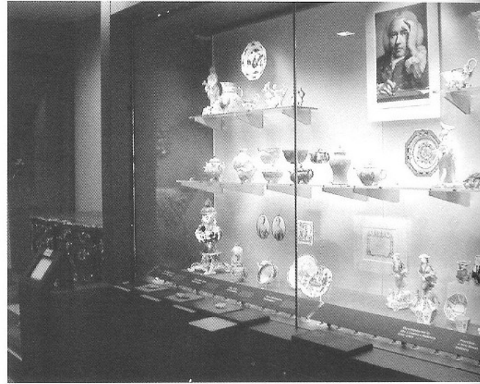
ΕΙΚ. 3 Άποψη από τις βραβευμένες Βρετανικές Αίθουσες του Victoria and Albert Museum

Τα ερμηνευτικά μέσα των μουσείων που μπορούν να χρησιμοποιηθούν ως «σημεία εισόδου» σε μια έκθεση είναι πολλά και καθένα έχει διαφορετικό στόχο και λειτουργία: τα αυθεντικά αντικείμενα και οι τρόποι με τους οποίους μπορούν να συσχετιστούν, ο γραπτός και προφορικός λόγος της