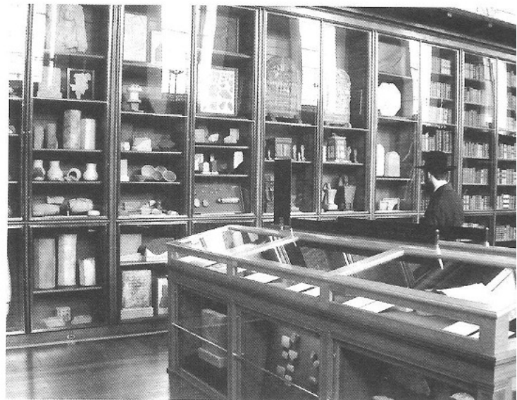
ΕΙΚ. 2 Άποψη της έκθεσης Διαφωτισμός. Ανακαλύπτοντας τον Κόσμο κατά τον 18ο αιώνα του Βρετανικού Μουσείου