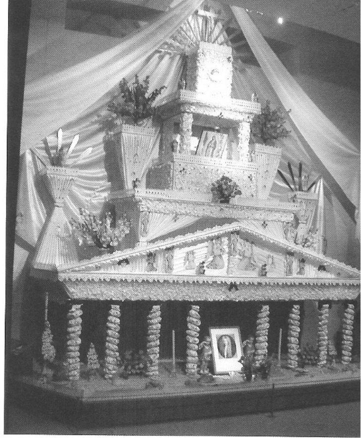
ΕΙΚ. 1 Άποψη από την επετειακή έκθεση του Βρετανικού Μουσείου Το Μουσείο της Σκέψης , η οποία αποτέλεσε αφορμή για τη δημιουργία εκθέματος εις μνήμην του ίδιου του Μουσείου και της 250ής επετείου από την ίδρυσή του.

Το Βρετανικό Μουσείο, για την 250ή επέτειο από την ίδρυσή του, οργάνωσε το 2003 την περιοδική έκθεση Το Μουσείο της Σκέψης (Εικ. 1) με θέμα τη Μνήμη σε όλες τις εκφάνσεις της, 28 απαραίτητο συστατικό για την αυτογνωσία, ταυτότητα και εξέλιξη κάθε ατόμου, κάθε κοινότητας αλλά και του ίδιου του Βρετανικού Μουσείου ως αποθετηρίου αντικειμένων-φορέων μνήμης διάφορων πολιτισμών και επομένως ως «θεάτρου μνήμης» αυτών των λαών. Τον Δεκέμβριο του 2003 άνοιξε στο ίδιο μουσείο η έκθεση Διαφωτισμός. Ανακαλύπτοντας τον Κόσμο κατά τον 18ο αιώνα (Εικ. 2), που επιχειρεί να αναπαραστήσει μία από τις σημαντικότερες και προοδευτικότερες περιόδους της ανθρώπινης ιστορίας και σκέψης. Ήταν η εποχή κατά την οποία η θέληση του ανθρώπου για οικοδόμηση στέρεων και αντικειμενικών γνώσεων για