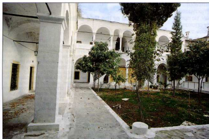
7. Το Ιμερέτ. Εσωτερικό αθίριο.

της συγκρότησης του αστικού ιστού, δεν αποτελούν συνεκτικό σύστημα. Ωστόσο, η παρουσία τους είναι ιδιαίτερα σημαντική για τη συνολική εικόνα του οικισμού, καθώς αποτελούν αστικούς συντελεστές με διαχρονική αξία, παρά τους διαδοχικούς μετασχηματισμούς του ρόλου και της σημασίας τους. Ειδικά στον οικισμό της Παναγίας, η παρουσία μνημείων και μνημειακών συνθέσεων είναι πρωταρχικής σημασίας. Μοναδικά κτίσματα, όπως τα τείχη, η ακρόπολη, το Τέμενος της Μουσικής (Χαλίλ Πασά) και το σπίτι του Μεχμέτ Αλή, λειτουργούν διαχρονικά ως πρωταρχικά οργανωτικά στοιχεία του αστικού χώρου και ως σημεία αναφοράς. Ανεξάρτητα από τη σημερινή λειτουργία τους, που είναι διαφορετική από την αρχική, τα μνημεία δεν παύουν να αποτελούν κυρίαρχα στοιχεία.