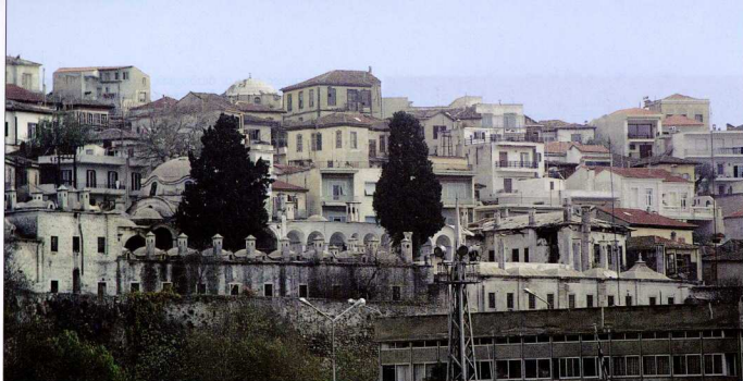
5. Το Ιμερέτ στο μέτωπο της θάλασσας.

Στους σύγχρονους τουριστικούς χάρτες, στο υπόμνημα των μνημείων, το Ιμερέτ έχει την τρίτη θέση και η βασιλική πλατεία με το σπίτι του Μεχμέτ Αλή την τέταρτη. Την πρώτη και δεύτερη θέση κατέχουν το υδραγωγείο και η ακρόπολη. Εύλογο είναι επομένως το επενδυτικό ενδιαφέρον για τα βακουφικά μνημεία, το οποίο δεν παραβλέπει ότι στους σύγχρονους τουριστικούς οδηγούς ο κατάλογος των εστιατορίων και των συναφών υπηρεσιών ανταγωνίζεται τον κατάλογο των μνημείων. Ωστόσο καμιά επένδυση δεν αθρώνει τους υπεύθυνους για την αλλοίωση της αστικής λειτουργίας των μοναδικών στοιχείων του οικισμού.