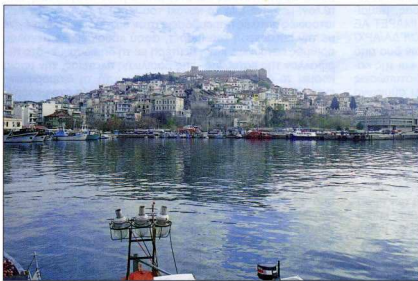
4. Το ιστορικό κέντρο Παναγία Καβάλας. Άποψη από το λιμάνι.

να αποτελεί μείζον οργανωτικό στοιχείο του αστικού χώρου.