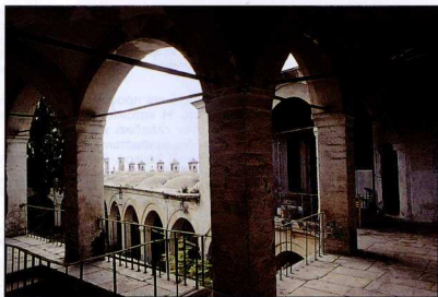
6. Το Ιμερέτ. Εσωτερικό αθίριο.

Στα μοναδικά στοιχεία του αστικού χώρου εντάσσονται κτίσματα που εξημερευτούν λειτουργίες και σκοπούς συνήθως διαφορετικούς από την κοινή κατοικία, το εμπόριο και τη μεταποίηση. Πρόκειται για κτίρια που δεν παρουσιάζουν επαναλαμβανόμενο χαρακτήρα και, αντίθετα με αυτό που συμβαίνει με τα τυπικά στοιχεία