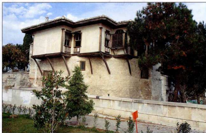
3. Το κονάκι του Μουχαράντ Αλί Πασά.

Μεταξύ των ετών 1817-1821, ο Μεχμέτ Αλή δώρισε στην Καβάλα το κτίριο του Ιμαρέτ, το οποίο καταλαμβάνει μια οικοδομική νησίδα. Το συγκρότημα αποτελεί όψιμο παράδειγμα εφαρμογής του θεσμού των βακουφιών σε μια μεταβατική περίοδο κατά την οποία εμφανίζονται οι πρώτες δυτικές επιρροές. Εξαιτίας του μεγέθους του και της σημασίας του, το συγκρότημα, που στεγάζει εκπαιδευτικές και φιλανθρωπικές λειτουργίες, συμβάλλει στην αναδιάρθρωση του αστικού χώρου. Η τυπολογία του Ιμαρέτ ακολουθεί τη χαρακτηριστική διάταξη κτισμάτων ομαδικής διαβίωσης, που αναμφισβήτητα είναι επηρεασμένη από το μοναστηριακό πρότυπο. Παρόλο που το κτίσμα έχει χάσει την αρχική (ιεροδιδασκαλείο-πτωχοκομείο) αλλά και τη μεταγενέστερη (στέγαση προσφύγων) χρήση του, εξακολουθεί