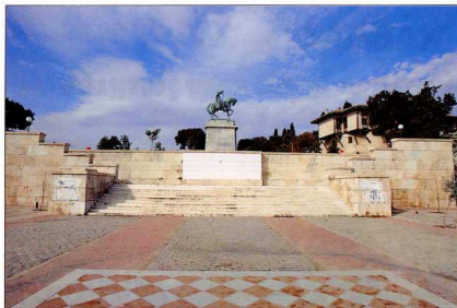
2. Η βασιλική πλατεία με τον έφιππο ανδριάντα του ηγεμόνα, και το κονάκι του Μουχαράντ Αλί Πασά.

που δεν αγνόησαν την αρχιτεκτονική των πόλεων.