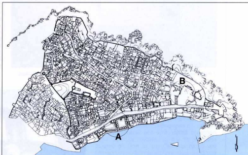
1. Χάρτης του ιστορικού κέντρου Καβάλας. Αποτύπωση Ισογειών (αποτύπωση ΑΠΘ, 1992). Διακρίνονται: α. το Ιμαρέτ (Α), και β. το κονάκι του Μουχαμάντ Αλί Πασά και η ρωσική πλατεία (Β).

Διαμαντής Αεμίτης. Το ελάχιστον της ζωής του 1