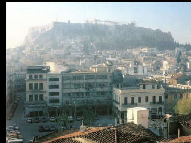
Η Πλάκα, ανάμεσα στις υπαίρειες του ιερού βράχου και τα παλιότερα κτίρια της σύγχρονης πόλης.

Δ. Α. Ζήβα, Πλάκα 1973-2003, το χρονικό της επέμβασης για την προστασία της Παλαιάς Πόλεως Αθηνών. Π.Ι.Ο.Π., 2006