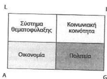
ΣΧΗΜΑ 3.3 Κοινωνία, τα υποσυστήματά της και τα λειτουργικά προαπαιτούμενα

αυστηρά τη δεύτερη γραμμή άμυνας. Ένα σύστημα λειτουργεί ιδανικά όταν ο κοινωνικός έλεγχος χρησιμοποιείται μόνο περιστασιακά. Κατά δεύτερον, το σύστημα πρέπει να είναι σε θέση να ανέχεται ένα βαθμό διαφοροποίησης και απόκλισης. Ένα ευέλικτο κοινωνικό σύστημα είναι ισχυρότερο από ένα άκαμπτο αλλά εύθραυστο σύστημα που δεν ανέχεται καμία παρέκκλιση. Τέλος, το κοινωνικό σύστημα θα πρέπει να προσφέρει ευρεία γκάμα ευκαιριών ανάληψης ρόλων, που θα επιτρέπει στις διαφορετικές προσωπικότητες να εκφράζονται χωρίς να απειλείται η συνοχή του συστήματος.