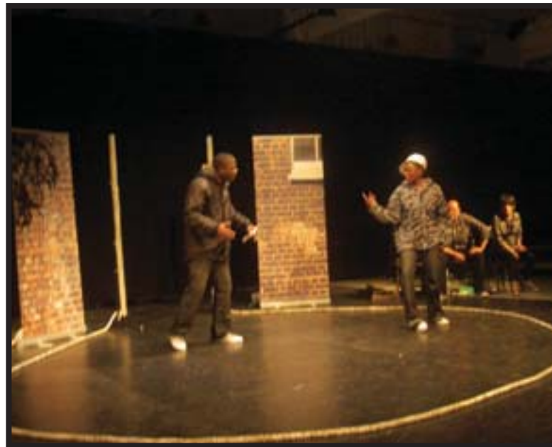
Οι CARDBOARD CITIZENS, Λονδίνο, στο Διεθνές Φεστιβάλ Θεάτρου Φόρουμ, Αυστρία, 22/10-1/11/09

γλώσσες διανθίζουν τη βιβλιογραφία κάθε χρόνο: Θ.τ.Κ. στην εκπαίδευση, Θ.τ.Κ. και ψυχόγραμμα, Θ.τ.Κ. και ψυχολογία, Θ.τ.Κ. και πολιτική, Θ.τ.Κ. στην κοινωνική εργασία (π.χ. Cohen-Cruz & Schutzman, 2006).