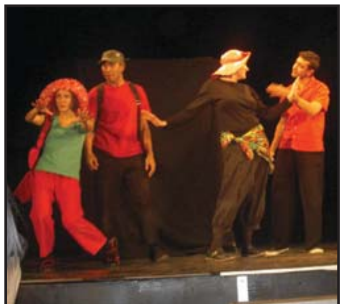
Οι Τ'ΟΡ, Λιλ, στο Διεθνές Φεστιβάλ Θεάτρου Φόρουμ, Αυστρία, 22/10-1/11/09

Το 2008 ο Μποάλ ήταν υποψήφιος για το Νόμπελ Ειρήνης. Το 2009 έγραψε το μήνυμα για την Παγκόσμια Ημέρα Θεάτρου που διαβάστηκε σε όλα τα θέατρα του κόσμου στις 27 Μαρτίου. Στο μήνυμά του γράφει: