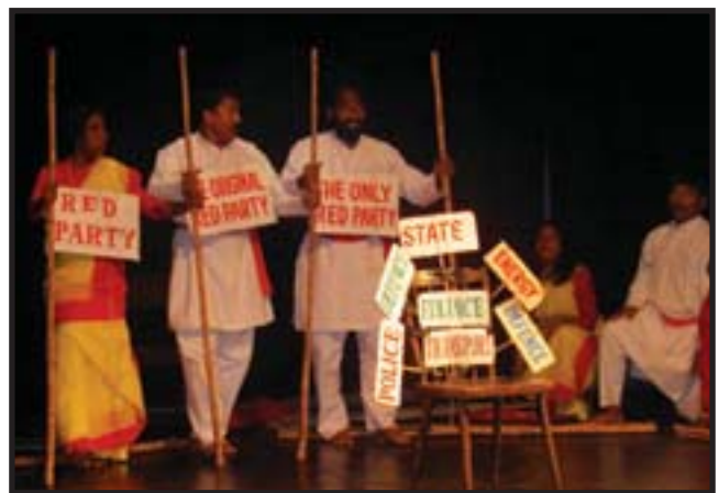
Οι JANA SANSKRITI, Καλκούτα, στο Διεθνές Φεστιβάλ Θεάτρου Φόρουμ, Αυστρία, 22/10-1/11/09