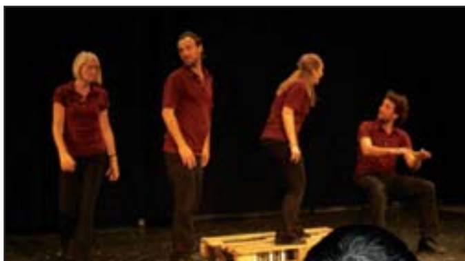
Οι GTO PARIS, Παρίσι, στο Διεθνές Φεστιβάλ Θεάτρου Φόρουμ, Αυστρία, 22/10-1/11/09

«Είναι πολύ εύκολο να προσποιείσαι ότι είσαι δημοκρατικός. Φτιάχνεις ένα χώρο και αφήνεις τους ανθρώπους να μιλήσουν. Αν είναι όμως μόνο για να μιλήσουν και όχι για να αναλάβουν δράση, όχι για να πραγματώσουν τα λόγια τους, τότε θα γίνει απλώς έναν χώρος όπου οι άνθρωποι ανακουφίζονται με το να εκφράζονται δυνατά. Τότε έχεις ανακούφιση αντί της χειραφέτησης. Επίσης εάν δεν γίνεσαι διαμεσολαβητής της συζήτησης, εάν δεν αναστοχάζεσαι κριτικά αυτό που λένε οι άνθρωποι, αν δεν παίρνεις θέση, τότε απλά ενισχύεις την κυρίαρχη δομή. (...) Η κοινωνία μας είναι σεξιστική και γι' αυτό προσπαθούμε να αγωνιζόμαστε εναντίον του σεξισμού. Είμαστε ταυτόχρονα οι άνθρωποι που προσπαθούν να αλλάξουν την κοινωνία και οι άνθρωποι που χρειάζεται οι ίδιοι να αλλάξουν μέσα από αυτή τη διαδικασία. Αλλά δεν μπορείς να πεις ότι δεν έχεις άποψη. Γιατί εάν δεν έχεις άποψη, τότε θα έρθει η μη ιδεολογία, που είναι στην πραγματικότητα η κυρίαρχη ιδεολογία. Αυτή που είναι αόρατη. Όλοι έχουν ιδεολογία. Και όλοι έχουν αισθητική. Υπάρχει αυτή που αναπαράγω και εκείνη που ανακαλύπτω και πάνω στην οποία αναστοχάζομαι κριτικά. Αυτή είναι η κύρια διαφορά. Έτσι, το να ανοίξω ένα χώρο όπου οι άνθρωποι θα λένε αυτά που συνήθως ακούμε στην τηλεόραση και στο ραδιόφωνο και που διαβάζουμε στις εφημερίδες, είναι άσκοπο. Απλώς αναπαράγω» (Boal, J., 2009).