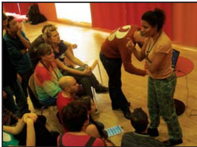
Η Μπάρμπαρα Σάντος στο Διεθνές Φεστιβάλ Θεάτρου Φόρουμ, Αυστρία, 22/10-1/11/09

πία εξουσίας. Αυτή η ανισορροπία προξενεί αδικία. Εκείνοι που έχουν εξουσία προσπαθούν να κρατήσουν τους υπόλοιπους χωρίς εξουσία. Όμως η καταπίεση δεν είναι κατάθλιψη. Ο καταπιεσμένος δεν είναι το ανήμπορο θύμα μιας καταπίεσης. Ο καταπιεσμένος είναι αυτός που έχει συνειδητοποιήσει την καταπίεση που βιώνει. Είναι αυτός που νιώθει τόσο την ανάγκη όσο και την επιθυμία για αλλαγή» (Santos, 2009)