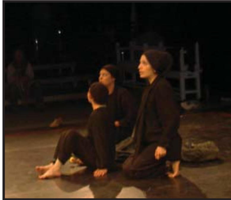
Οι TO-TEHRAN, Τεχεράνη, στο Διεθνές Φεστιβάλ Θεάτρου Φόρουμ, Αυστρία, 22/10-1/11/09

Στις ΗΠΑ η οργάνωση Pedagogy and Theatre of the Oppressed Company κάθε χρόνο συγκεντρώνει από 300-900 συμμετοχές από όλο τον κόσμο. Κέντρα Θ.τ.Κ. και ομάδες δρουν στο Πακιστάν, στην Ουγκάντα, στην Κένυα, στην Μπουρκίνα Φάζο, στο Τογκό, στη Σενεγάλη, στη Σιγκαπούρη, στην Τουρκία, στο Ιράν και στις περισσότερες λατινοαμερικάνικες και ευρωπαϊκές χώρες. Πολλά νέα βιβλία, διατριβές και άρθρα σε πολλές