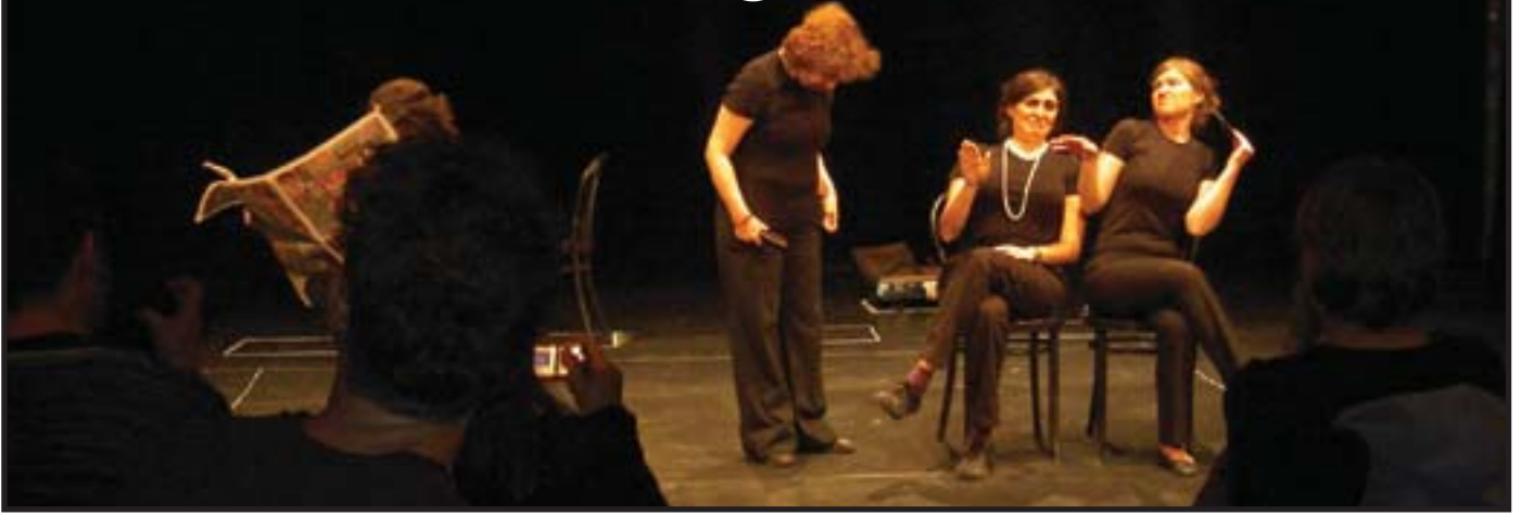
Οι ΤΙΥΑΤΡΟ ΒΟΥΑΛΙ ΚΥΣ, Κωνσταντινούπολη, στο Διεθνές Φεστιβάλ Θεάτρου Φόρουμ, Αυστρία, 22/10-1/11/09

Το 1992 ο Μποάλ εκλέγεται ως αντιπρόσωπος του Εργατικού Κόμματος στη θέση του Vereador, στο δημοτικό συμβούλιο του Ρίο ντε Τζανέιρο. Τόσο στην προεκλογική εκστρατεία όσο και κατά τη διάρκεια της θητείας του χρησιμοποιεί μια νέα μορφή του Θ.τ.Κ, το νομοθετικό θέατρο, μια εξέλιξη του θεάτρου φόρουμ, κατά την οποία οι πολίτες στις γειτονιές της πόλης, οι εργάτες στα συνδικάτα και άλλες ενώσεις πολιτών, σε ένα είδος λαϊκής συνέλευσης επεξεργάζονται τα προβλήματά τους και προτείνουν νομοθετικές ρυθμίσεις προς το δημοτικό συμβούλιο. Δεκατρείς τέτοιες διατάξεις που προτάθηκαν κατά τις παραστάσεις-συνεδρίες του νομοθετικού θεάτρου ψηφίστηκαν τελικά και έγιναν νόμοι του Ρίο. Το 1998 δημοσίευσε το βιβλίο Legislative Theatre (Routledge, London), μια περιγραφή των τεχνικών και με την κριτική του εγχειρήματος. Το βιβλίο αυτό τελειώνει με την ιδέα του νομοθετικού θεάτρου χωρίς το νομοθέτη και ένα ανανεωμένο άνοιγμα του Μποάλ στα κινήματα βάσης, όπως το 2002 που συμμετέχει μαζί με τους Sem Terra στο Διεθνές Κοινωνικό Φόρουμ του Πόρτο Αλέγκρε.