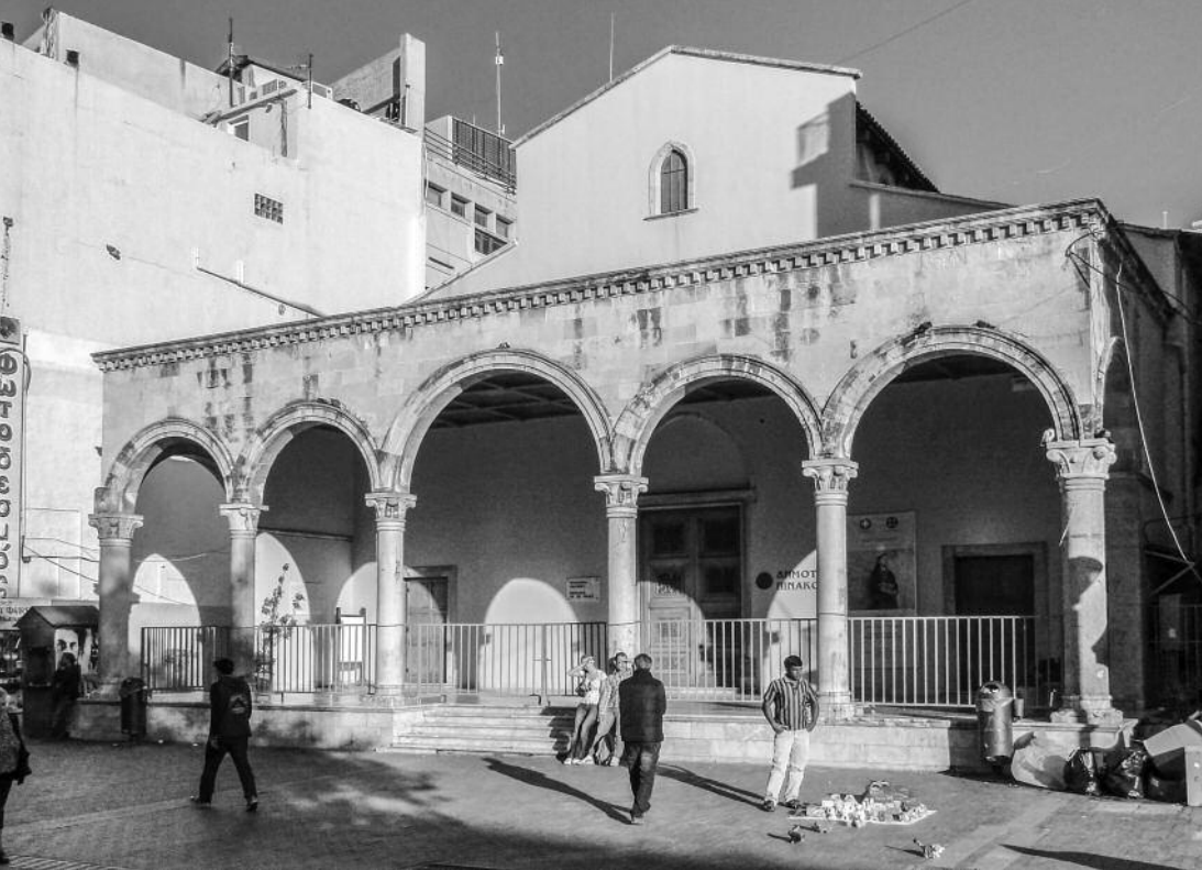
Ηράκλειο, ο Δουκικός ναός του Αγίου Μάρκου