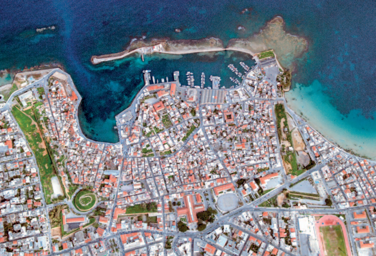
Χανιά, η Βενετσιάνικη πόλη (2004, Αερολέσχη Χανίων)

τηρητέο μνημείο, γίνονται πολλές προσπάθειες, που διαρκώς εντείνονται, για την προστασία και ανάδειξη του μνημειακού συνόλου.