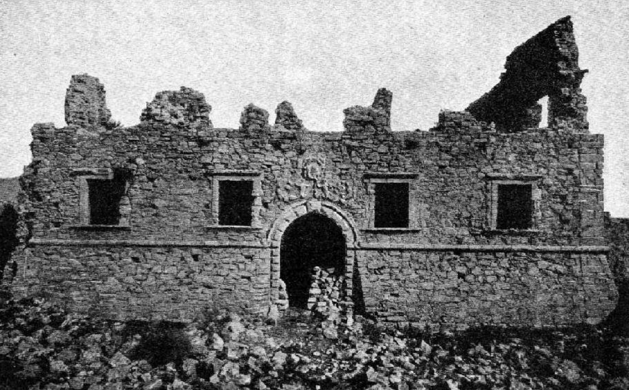
Ετιά Σητείας, έπαυλη Dei Mezzo (G.Gerola 1903)

Ιεράπετρας, ένα χαρακτηριστικό δείγμα της παλιότερης οχυρωτικής, πριν από την ανάπτυξη του προμαχωνικού συστήματος. Πρόσφατα ολοκληρώθηκαν και οι εργασίες υποθεμελίωσης, καθοριστικές για τη σωτηρία του. Ένα ακόμη σημαντικό κτίσμα, η έπαυλη της οικογένειας De Mezzo στο μικρό χωριό Ετιά της Σητείας έχει αποκτηθεί από το ΥΠΠΟ και έχει σε μεγάλο βαθμό αποκατασταθεί. Πολλές ακόμη είναι οι επεμβάσεις σε μνημεία της ίδιας περιόδου στο νομό Λασιθίου, τα οποία είτε αποτελούν καθαρά Βενετσιάνικα έργα, είτε έχουν επηρεαστεί ισχυρά από την αρχιτεκτονική της εποχής.