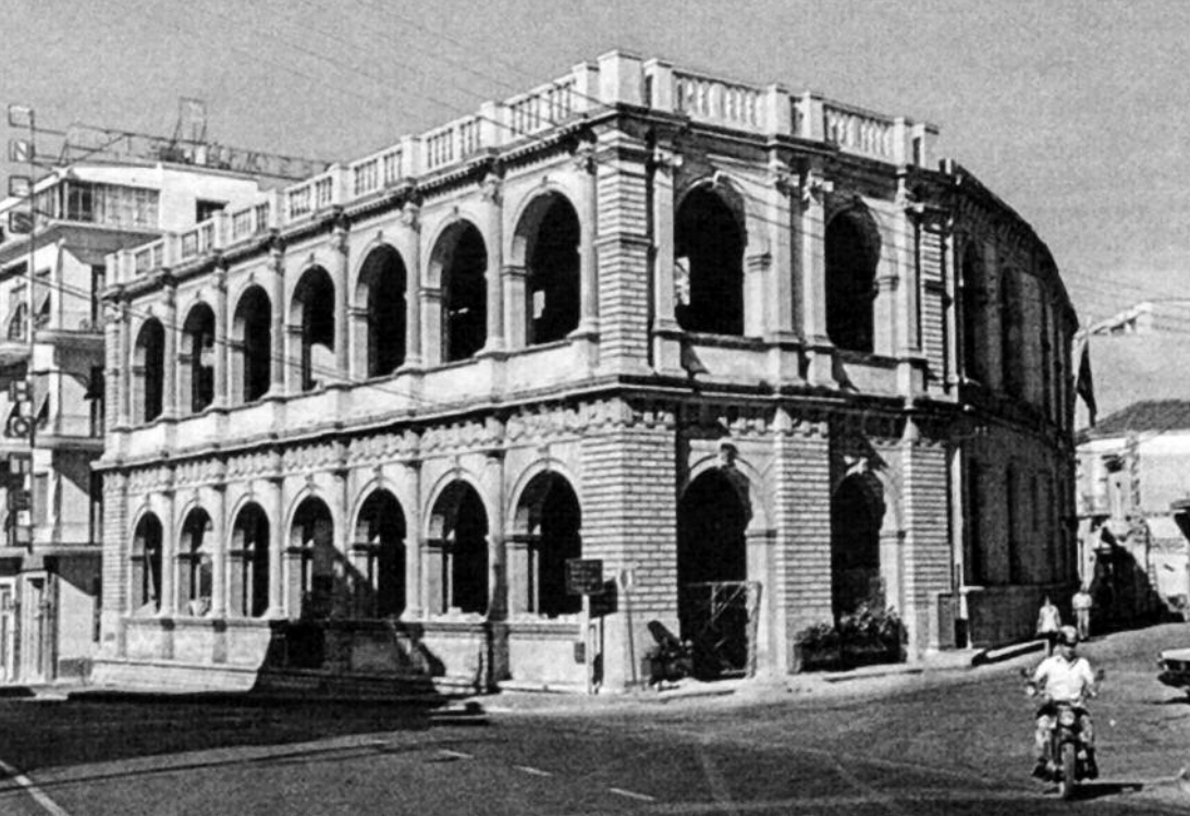
Η Λότζια του Ηρακλείου

αρχίσει να υπάρχουν σημαντικές αλλαγές στην ανάπτυξη των πόλεων, με την επικράτηση του ρεύματος του Νεοκλασικισμού και του Οθωμανικού Εκλεκτικισμού, που αποτέλεσαν για τους δυο λαούς και τρόπο έκφρασης της ιδιαιτερότητας εκάστου. Οι νέες αυτές τάσεις για την Κρήτη επικράτησαν ολοκληρωτικά στις αναπτυσσόμενες εκτός των τειχών συνοικίες και σε σημαντικό βαθμό στα περιτειχισμένα τμήματά τους. Έτσι η αρχιτεκτονική στην Κρήτη, άρχισε για μια ακόμη φορά να αλλάζει, αν και πολλά κλασικιστικά στοιχεία ήταν κοινά. Παρά τις μεγάλες αυτές αλλαγές ωστόσο, εξακολουθούσε να υπάρχει και να χρησιμοποιείται ένας μεγάλος αριθμός από κτίσματα της Βενετικής περιόδου, τα οποία άντεξαν λόγω και της πολύ καλής κατασκευής τους. Η στάση του πληθυσμού απέναντι στα μνημεία αυτά ήταν γενικά θετική, όπως και των λογίων, που συχνά εκφράζονται γι' αυτά με θαυμασμό. Τα τείχη ωστόσο των πόλεων θεωρήθηκαν σαν μισητά σύμβολα της μακροχρόνιας σκλαβιάς, εμπόδια στην ανάπτυξη και εκσυγχρονισμό των πόλεων, αλλά και τις κερδοσκοπικές τάσεις, που αναπτυσσόταν. Με μεγάλα ρήγματα, που δημιουργήθηκαν στα τείχη επιχειρήθηκε η ενοποίηση των παλιών με τις νέες