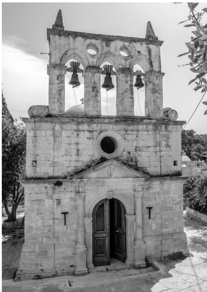
Κυριάννα Ρεθύμνου, δυτική όψη ναού Παναγίας

Χανίων, το σύνθετο οχυρωματικό σύστημα της πόλης και του λιμανιού της Σούδας, μεμονωμένα κτίσματα στην ύπαιθρο και ορθόδοξες μονές και ναούς με ισχυρές επιδράσεις από τη Βενετσιάνικη παρουσία. Η παλιά πόλη των Χανίων συνεχίζει να ακμάζει εδώ και πέντε χιλιετίες στον ίδιο χώρο και διασώζει μια σειρά από σημαντικά μνημεία σχεδόν όλων των εποχών στο χώρο της παλιάς πόλης. Θα πρέπει να επισημάνουμε ότι ο βομβαρδισμός από τα Γερμανικά αεροπλάνα το 1941 προκάλεσε σοβαρότατες καταστροφές, ότι έγιναν και εδώ επί σειρά δεκαετιών λανθασμένες ενέργειες, από το 1965 ωστόσο και μετά, που η παλιά πόλη χαρακτηρίστηκε σε ιστορικό δια-