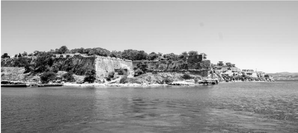
Η οχυρωμένη νησίδα της Σούδας

υψηλής προτεραιότητας στα πλαίσια βέβαια των δυνατοτήτων, που υπάρχουν γενικότερα.