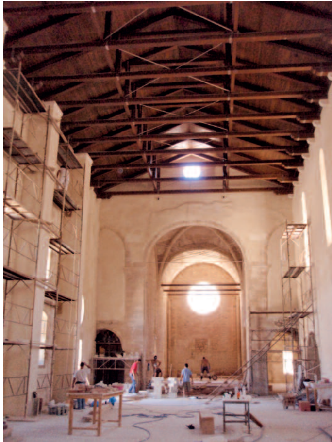
Ηράκλειο, ναός Αγίου Πέτρου των Δομηνικανών κατά τις εργασίες αποκατάστασης (2010)

βανδαλική κατεδάφιση από τη Δικτατορία του μεγάλου ναού του Σωτήρα των Αυγουστινιανών για να πάρει τη θέση του μια ουδέτερη πλατεία.