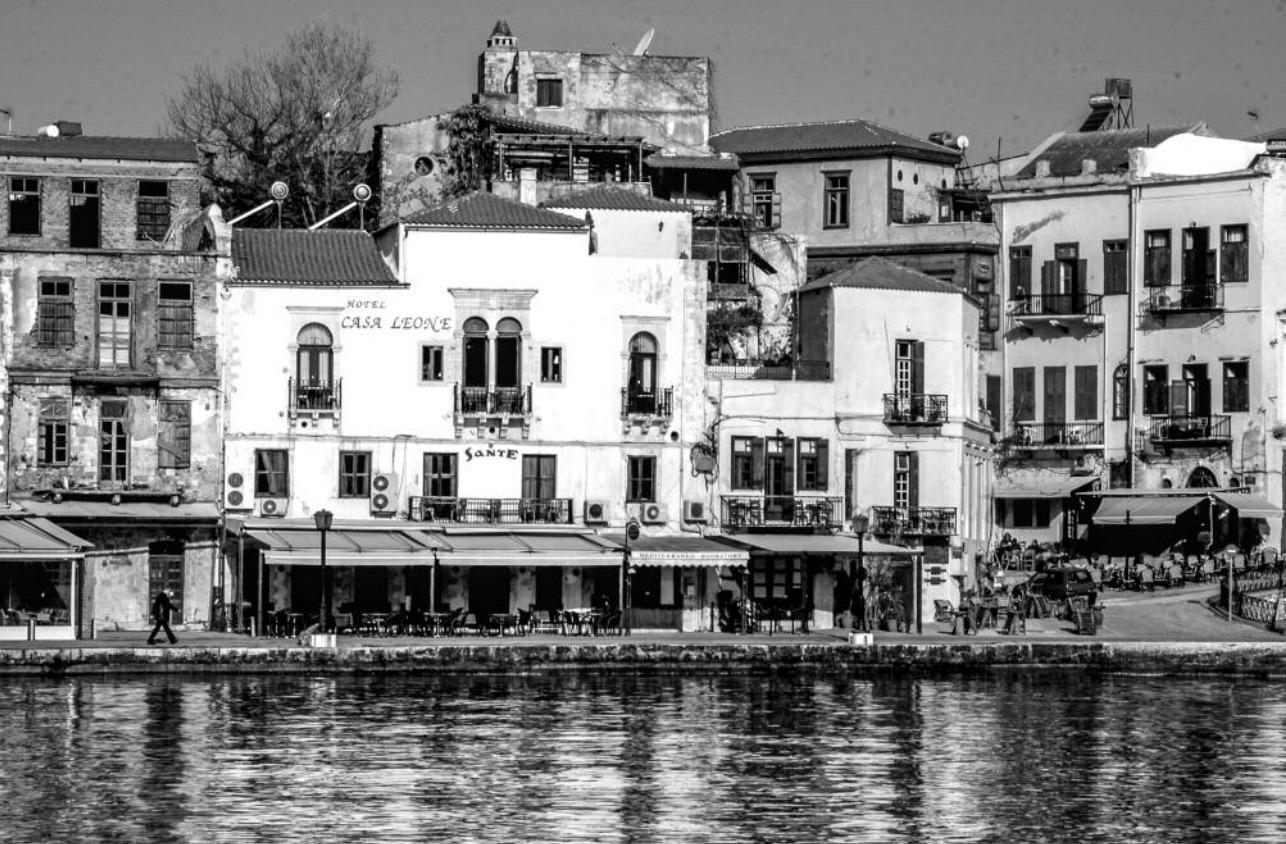
Χανιά, Βενετσιάνικο μέγαρο

του Δήμου Χανίων είναι και οι εργασίες αποκατάστασης ενός μεγάλου κτίσματος, που είχε χρησιμοποιηθεί πιθανώς ως Ναυαρχείο και αργότερα ως Δημαρχείο. Από τα 11 σωζόμενα νεώρια έχουν αποκατασταθεί τα δυο και ολοκληρώθηκε η άρση της ετοιμοροπίας του μεγάλου συγκροτήματος των επτά νεωρίων, που επιβαρύνθηκε προ ετών από σεισμό. Ήδη ολοκληρώνουμε τη σύνταξη της μελέτης αποκατάστασης και αναμένεται η χρηματοδότηση από το Κοινοτικούς πόρους. Η αρχιτεκτονική μελέτη έχει παραδοθεί στο Δήμο Χανίων.