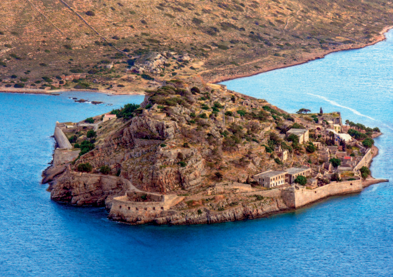
Η οχυρωμένη νησίδα Σπινα- λόγκα από βορειοδυτικά

των κτισμάτων. Η ανάπτυξη των οικισμών γύρω από τις αρχικές οχυρώσεις, στους εξώβουργους έφερε νέες αρχιτεκτονικές και αλλαγές στη ρυμοτομία, που ρυθμίστηκε οριστικά με την κατασκευή των εξωτερικών οχυρώσεων κατά το 16 ο αιώνα. Οι συχνοί μεγάλοι σεισμοί, όπως αυτός του 1204, που εξαφάνισε ένα μεγάλο αριθμό από ναούς και άλλα κτίσματα της δεύτερης βυζαντινής περιόδου, υποχρέωναν τις αρχές και τους κατοίκους σε επισκευές, ή ανακατασκευές των διάφορων κτισμάτων. Τέλος οι νέες τάσεις στο χώρο της αρχιτεκτονικής, που ήταν σε εξέλιξη στη Μητρόπολη, έφταναν στην Κρήτη μέσα από τις κατευθείαν αμφίδρομες επαφές, είτε μέσα από τα βιβλία των θεωρητικών του Μανιερισμού, όπως ήταν ο Andrea Palladio και ο Sebastiano Serlio, επιδράσεις των οποίων έχουν αναγνωριστεί σε κτίσματα της Κρήτης. Οι τρεις βασικοί αυτοί λόγοι διαμόρφωσαν το δομημένο περιβάλλον του νησιού στα τέλη της Βενετοκρατίας, όπως το γνωρίζουμε