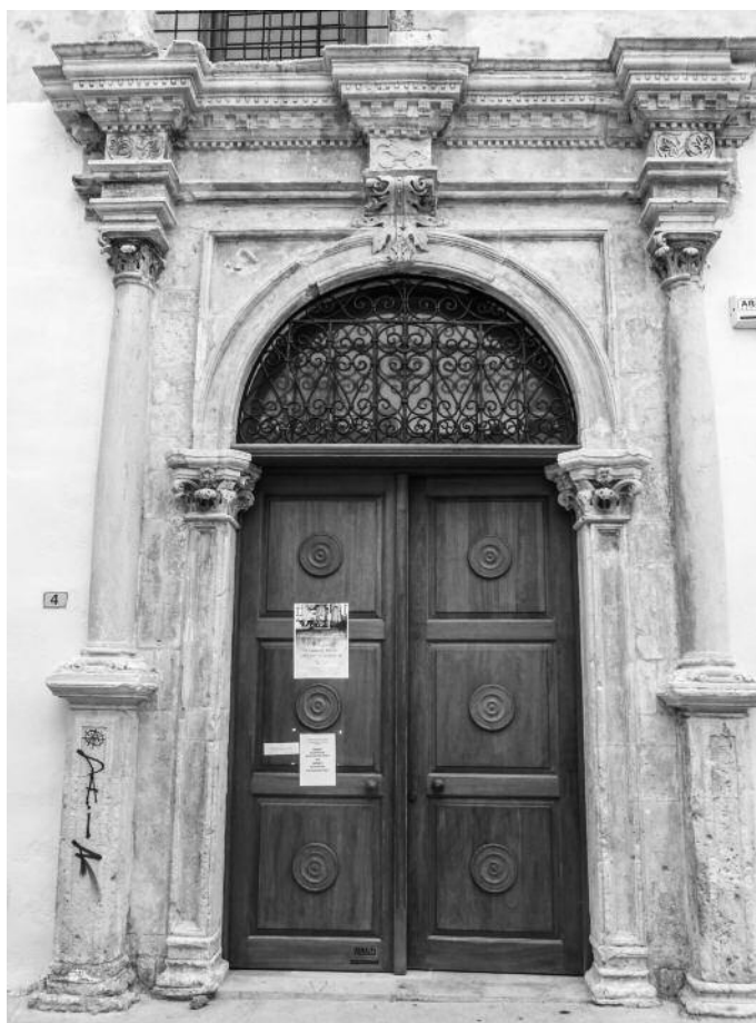
Ρέθυμνο, η κεντρική πύλη του Αγίου Φραγκίσκου.

Στην ύπαιθρο του νομού Ρεθύμνου σώζονται αρκετά μνημεία της περιόδου, ιδίως επαύλεις, ενώ παρατηρούνται ισχυρότατες επιρροές του Βενετσιάνικου Μανιερισμού στην τοπική αρχιτεκτονική κατά τους επόμενους αιώνες. Οι επιδράσεις αυτές αναγνωρίζονται ακόμη και στην ορθόδοξη ναοδομία, αλλά και στα μουσουλμανικά τεμένη, που κτίστηκαν μετά την άλωση και τα οποία στο σύνολό τους σχεδόν έχουν αποκατασταθεί (Καρά Μουσά, Ιμπραήμ Χαν). Χαρακτηριστική