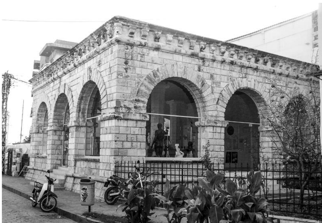
Η Λότζια του Ρεθύμνου

είναι η περίπτωση της Μονής Αρκαδίου, ιδιοκτησίας της οικογένειας Καλλέργη, όπου στην όψη του καθολικού αναγνωρίζονται κατευθείαν επιδράσεις από τα έργα και τα σχέδια αρχιτεκτονικής του Sebastiano Serlio και του Andrea Palladio. Στη Μονή, η οποία υπέστη εκτεταμένες καταστροφές από την εθελοντική ανατίναξη των υπερασπιστών της το 1866, έγιναν εκτεταμένες επεμβάσεις. Αποκαταστάθηκαν τα κτίσματα στις πτέρυγες, συντηρήθηκε η όψη του καθολικού από λαξευτό πωρόλιθο, συντηρήθηκαν τα άμφια και τα άλλα κειμήλια, που και σε αυτά διακρίνονται βενετσιάνικες επιρροές και αποκαταστάθηκε ο χώρος της αποθήκης λαδιού, που στεγάζει το νέο Μουσείο της Μονής. Ένας άλλος ναός της Παναγίας στο κοντινό χωριό Κυριάννα, που κτίστηκε στα βυζαντινά χρόνια και γνώρισε εκτεταμένες επεμβάσεις κατά τη Βενετοκρατία, αποκαταστάθηκε με ανάδειξη των διάφορων οικοδομικών φάσεων.