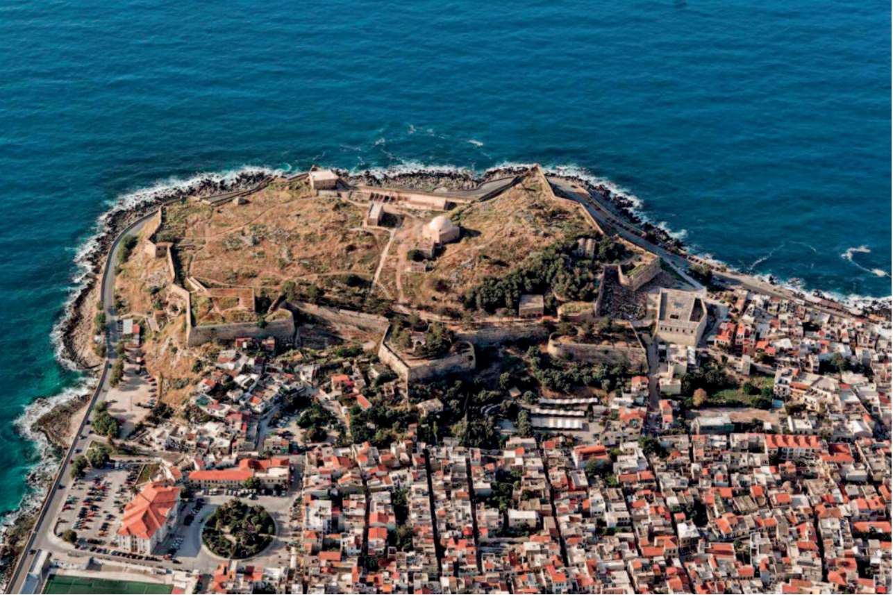
Το φρούριο Φορτέτζα του Ρεθύμνου

καταστάθηκε το καθολικό της Μονής του Αγίου Φραγκίσκου με τα παρεκκλήσιά του, που στεγάζει προσωρινά το Αρχαιολογικό Μουσείο του Ρεθύμνου. Επίσης έγιναν επεμβάσεις στο καθολικό της Μονής της Παναγίας των Αυγουστινιανών, που είχε μετατραπεί σε τζαμί, με ανάδειξη του πολυπολιτισμικού χαρακτήρα του. Ο μεταξύ των δυο μνημείων, μεγάλος ελεύθερος χώρος διαμορφώθηκε από το Δήμο Ρεθύμνου, με τον με την αποκατάσταση σειράς κτισμάτων για κοινωνικές και πολιτιστικές χρήσεις και η περιοχή πήρε μια εντελώς διαφορετική μορφή και χρήση. Το χαρακτηριστικό κτήριο της Λότζιας, που λειτούργησε και ως τζαμί, αποκαταστάθηκε και στεγάζει το πωλητήριο αντιγράφων αρχαίων του Ταμείου Αρχαιολογικών Πόρων. Τελευταία έχει τεθεί σε δημόσιο διάλογο από φορείς του Ρεθύμνου το θέμα της ανακατασκευής του πύργου του Ωρολογίου, κάτι που θα μπορούσε πιθανώς να γίνει σε θέση εκτός της παλιάς πόλης. Τέλος αρκετές επεμβάσεις σε μικρότερα κτίρια, αλλά και σε κοινόχρηστους χώρους από το Δήμο