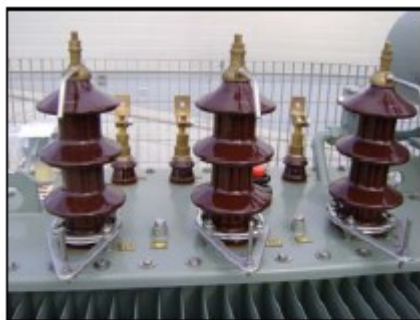
Ακροδέκτες ΥΤ και ΧΤ