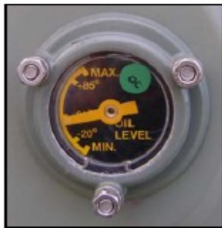
Στάθμη λαδιού στο Δοχείο διαστολής.