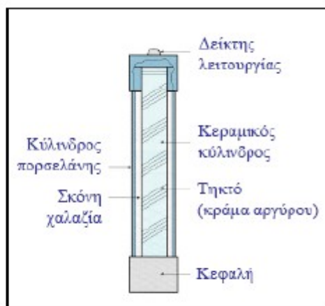
Βασικά μέρη μιας Ασφάλειας Σκόνη