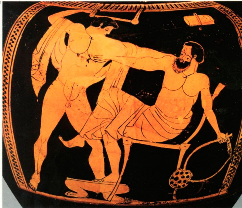
91. Έλεγαν πως ο Λίνος, ο μεγάλος δάσκαλος της μουσικής, βαστούσε από τη βασιλική γενιά του Άργους. Ήταν γιος της Ψαμάθης, της κόρης του βασιλιά Κρότωνου και του θεού της μουσικής, του Απόλλωνα. Ο Λίνος είχε κακό τέλος. Τον σκότωσε ένας από τους περιφανείς μαθητές του, ο Ηρακλής, γιατί οργίστηκε με τις παρατηρήσεις του την ώρα του μαθήματος. Στην παράσταση αυτή, την πιο δραματική από τις άλλες γνωστές παραστάσεις του μύθου, ο Ηρακλής έχει αρπάξει τον Λίνο από τον ώμο και τον χτυπά στο κεφάλι όχι με μουσικό όργανο, αλλά με ακμίνι. Ο Λίνος καθισμένος, κρατώντας ακόμα στο χέρι του τη λύρα, τον ικετεύει να τον λυπηθεί, προσπαθώντας ταυτόχρονα να αποφύγει τα χτυπήματα που του πληγώνουν το κεφάλι. (Ερυθρόμορφη στάμνος, Γύρω στο 480 π.Χ. Βοστώνη, Museum of Fine Arts).

Ο μύθος του Λίνου, θεού αρχικά όμοιου με τον Άδωνη και τον Διόνυσο, έχει πλαστεί για να αιτιολογήσει τη λατρεία του, σχετική με τη βλάστηση. Τα σκυλιά που τον κατασπάραξαν βρέφος, είναι τα κυνικά καύματα, που ξεραίνουν τους τρυφερούς βλαστούς. Έτσι δικαιολογούσαν και το γεγονός ότι στη γιορτή του θυσίαζαν σκύλους. Στην ιστορική διαδρομή του ο μύθος συμπληρώθηκε με τοπικές παραδόσεις από συγγενικά λατρευτικά κέντρα. Με την αγάπη τους στη λατρεία του Λίνου, όπως και στη λατρεία του Απόλλωνα, οι ποιμενικοί πληθυσμοί της δωρικής Αργολίδας συσχέτισαν τον αδικωμένο ήρωά τους με τον μεγάλο θεό του φωτός και της μουσικής, προβάλλοντάς τον και σαν δάσκαλο, πλάι στον Φορωνέα, τον Παλαμήδη και άλλους Αργείους ήρωες του πολιτισμού. – Σημιακή είναι και η καταγωγή και η ονομασία του Λίνου, που φαίνεται προσωποποίηση από κάποια θρηνητική κραυγή με τη σημασία του «αλίμονο»· το ίδιο σήμαινε και ο Ιάλεμος, παρόμοιος θεός, που αργότερα ταυτίστηκε με τον Λίνο.